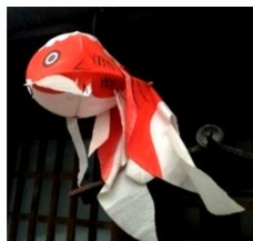
柳井名物 金魚ちょうちん