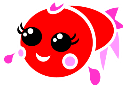
イメージキャラクター かんぎょちゃん