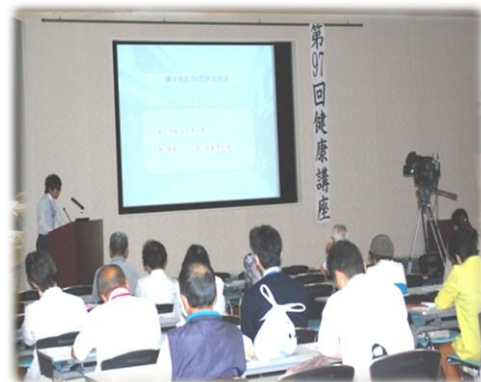
講演会や健康講座