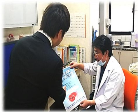
開業医の先生にご挨拶