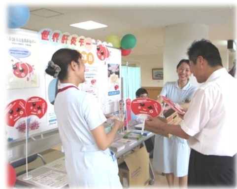
啓発キャンペーン