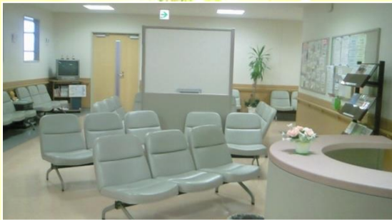
半日人間ドック待合室