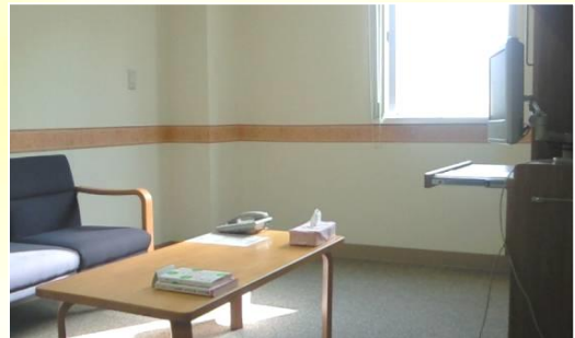
一泊二日人間ドック専用控え室(個室)